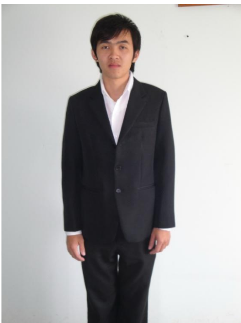
เสื้อสูทพิธีการนักศึกษาชาย