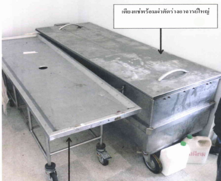
โต๊ะทำงานชำแหละร่างอาจารย์ใหญ่