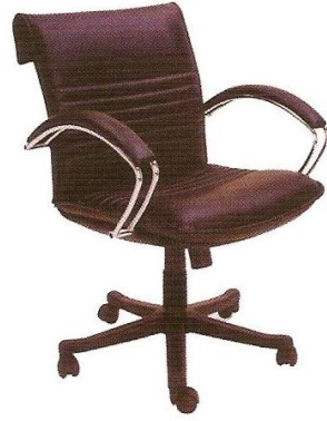
610(W) x 630(D) x 860(H) mm.