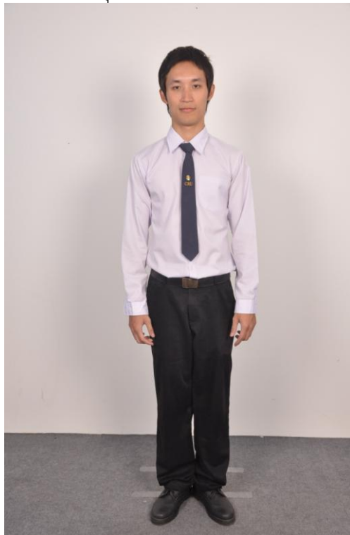
ชุดนักศึกษาชาย