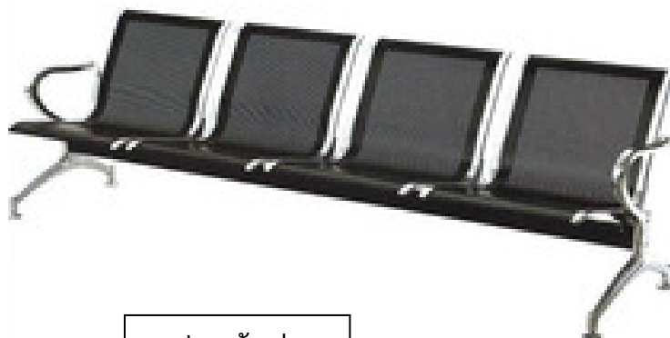
รูปภาพตัวอย่าง