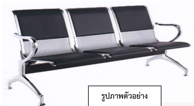
รูปภาพตัวอย่าง